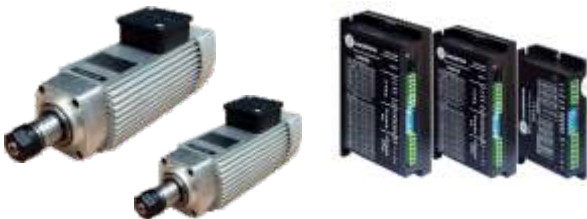
Spindle Motorlar ve Sürücüler