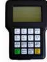
DSP El Terminali