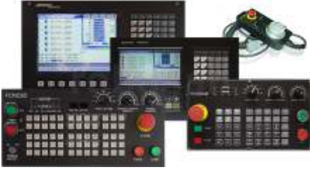
CNC Kontrol Üniteleri