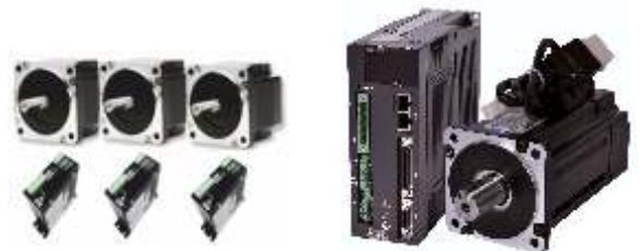
Servo & Step Motor ve Sürücüler