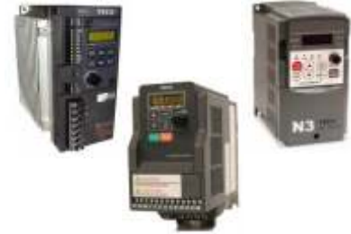
Spindle Sürücüler (invertörler)